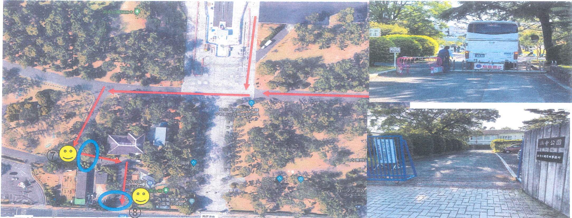
公園管理事務所前⑦⑧(2名)